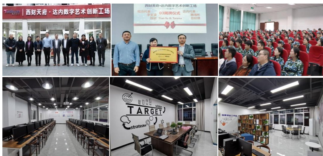
◆ 视觉传达专业精英班启动及天府-达内数字艺术创新工场实景图